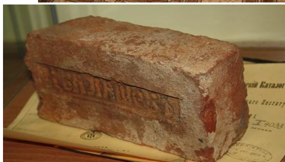
Кирпич с клеймом «К. Балашовъ»