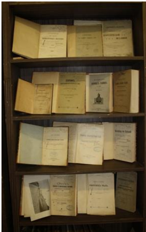
Пожертвования в библиотеку