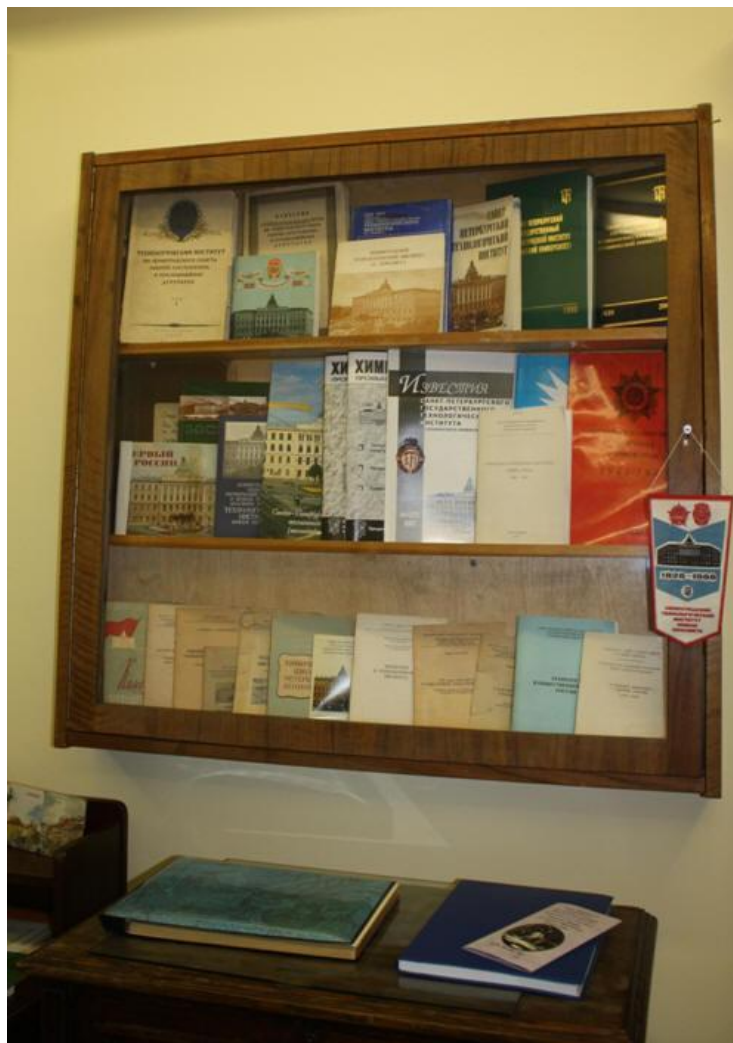
Витрина, посвящённая истории и деятельности Технологического института

Отдельная витрина посвящена химику и историку искусств В. Я. Курбатову, проработавшему в институте около полувека. На ней представлены как его технические книги, так и работы об архитектурных памятниках Санкт-Петербурга.