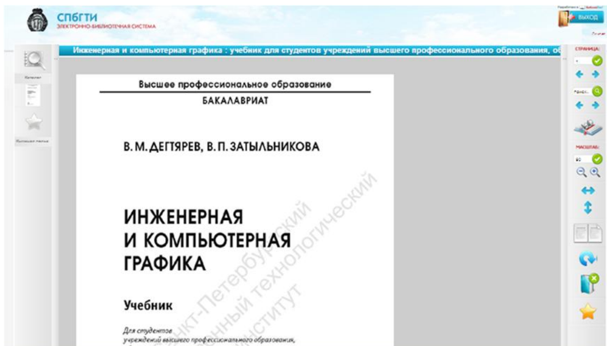
Рис. 4. Чтение книги