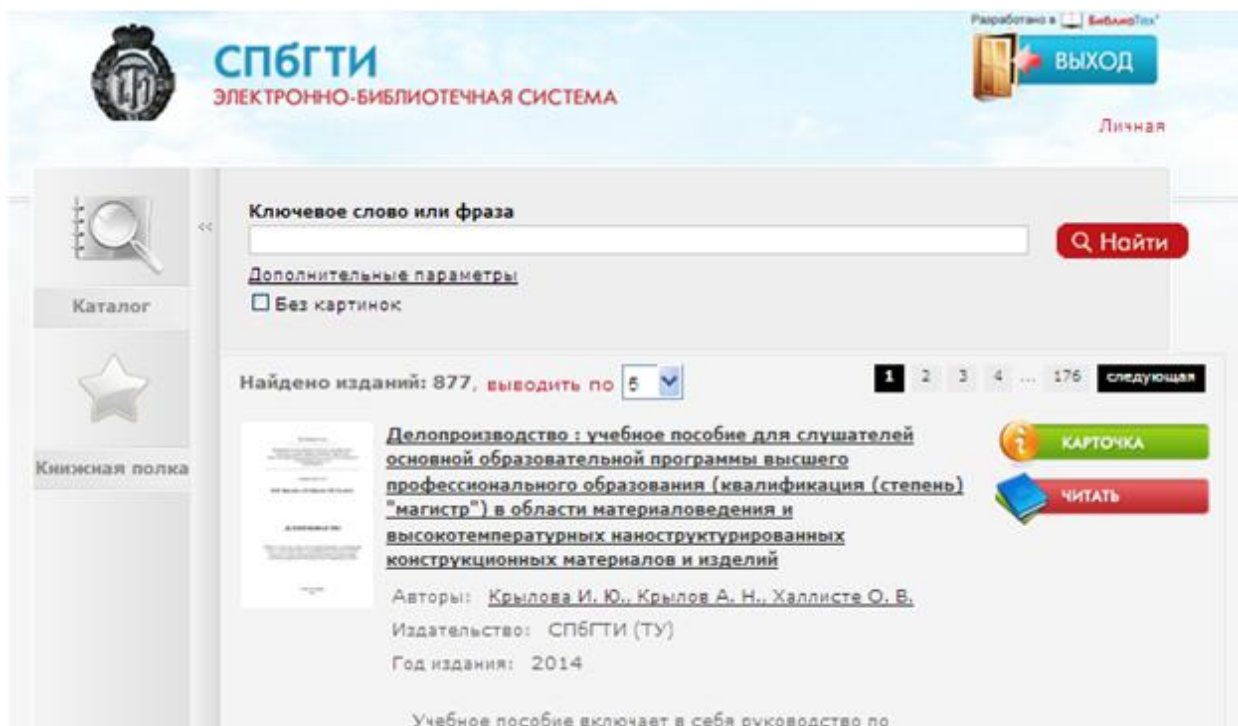
Рис. 1. Главный экран системы

Для входа в Электронный читальный зал откройте закладку «Электронная библиотека» на сайте ФБ и кликните «Вход в Электронный читальный зал». Выберите тот сервис, через который Вы проходили регистрацию. Кликните «Войти». Вы попадете в каталог Электронной библиотеки вуза (Рис. 1.)