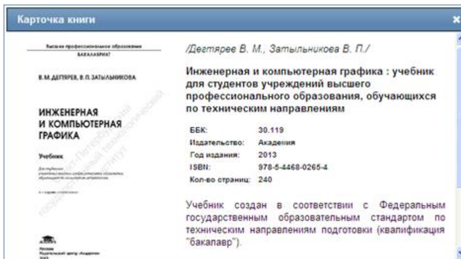
Рис. 2. Карточка книги.

. «Карточка» - кнопка, при нажатии на которую на экран выводится краткое описание и аннотация